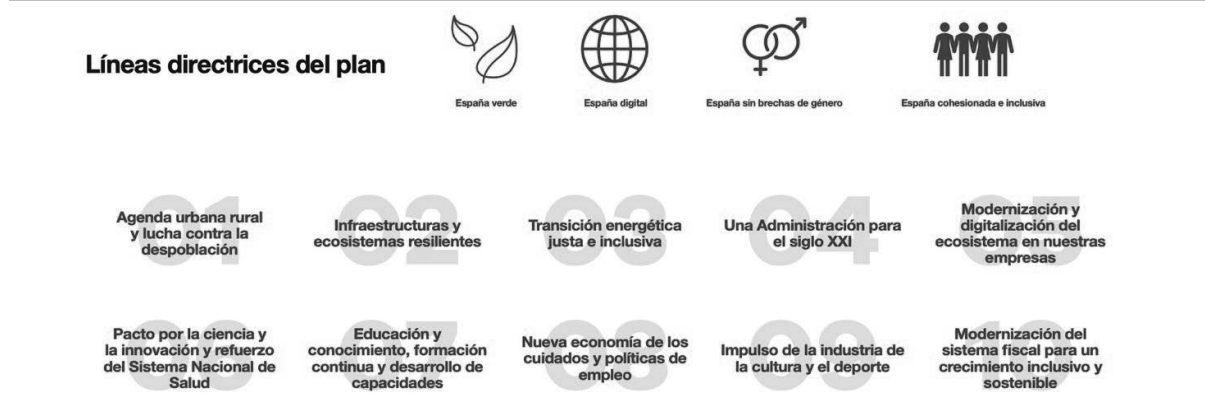
FIGURA 1 EJES TRANSVERSALES Y POLÍTICAS PALANCA DEL PLAN «ESPAÑA PUEDE»

Nota: las cifras están en millones de €