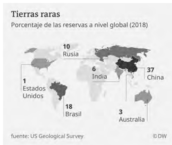
FIGURA 2 RESERVA DE TIERRAS RARAS