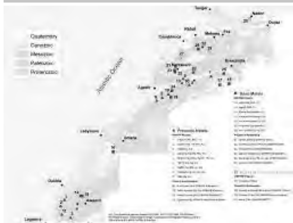
FIGURA 5 PROYECTOS DE MINERÍA